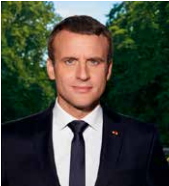
Emmanuel Macron Président de la République